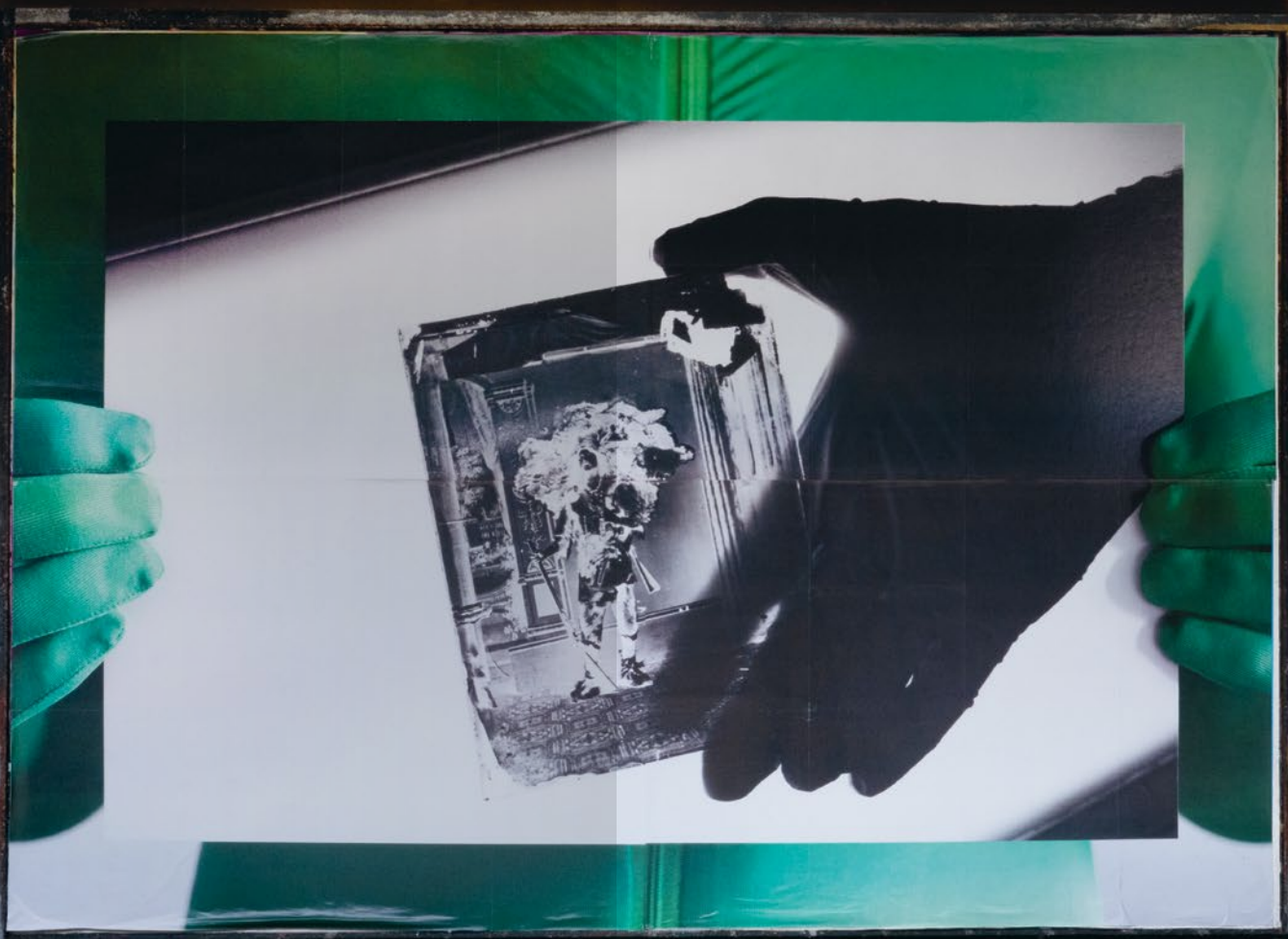
The Hunter and the Invisible Man , 2022, Plakatwand / billboard print, 356 × 252 cm Installationsansicht: Platz vor dem LABOR Köln / installation view: square in front of LABOR, Cologne, Foto / photo: Jana Müller