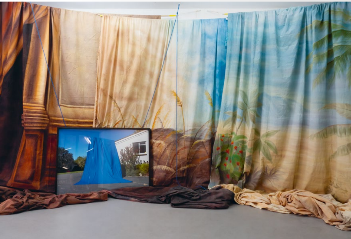
Isel Park Research Facility – Nelson Provincial Museum Pupuri Taonga o Te Tai Ao Installationsansicht mit drei handbemalten Fotostudio-Hintergründen / installation view with three hand-painted photographic studio backgrounds, LABOR Köln / Cologne