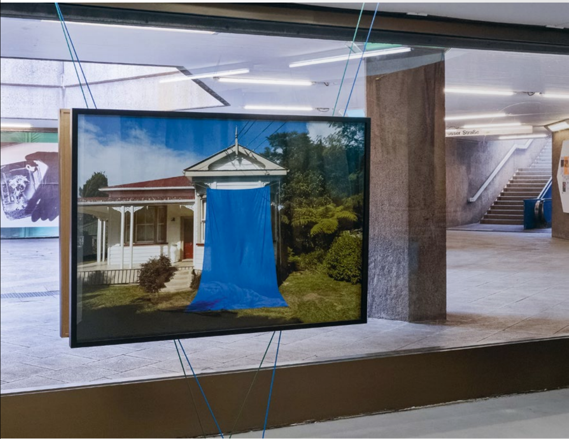
Clevedon Installationsansicht mit Blick auf den Ebertplatz / installation view looking at Ebertplatz, Foto / photo: Michael Nowotny