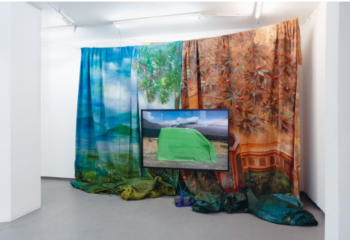
Arthur's Pass National Park Installationsansicht mit zwei handbemalten Fotostudio-Hintergründen / installation view with two hand-painted photographic studio backgrounds, LABOR Köln / Cologne, Foto / photo: Jana Müller