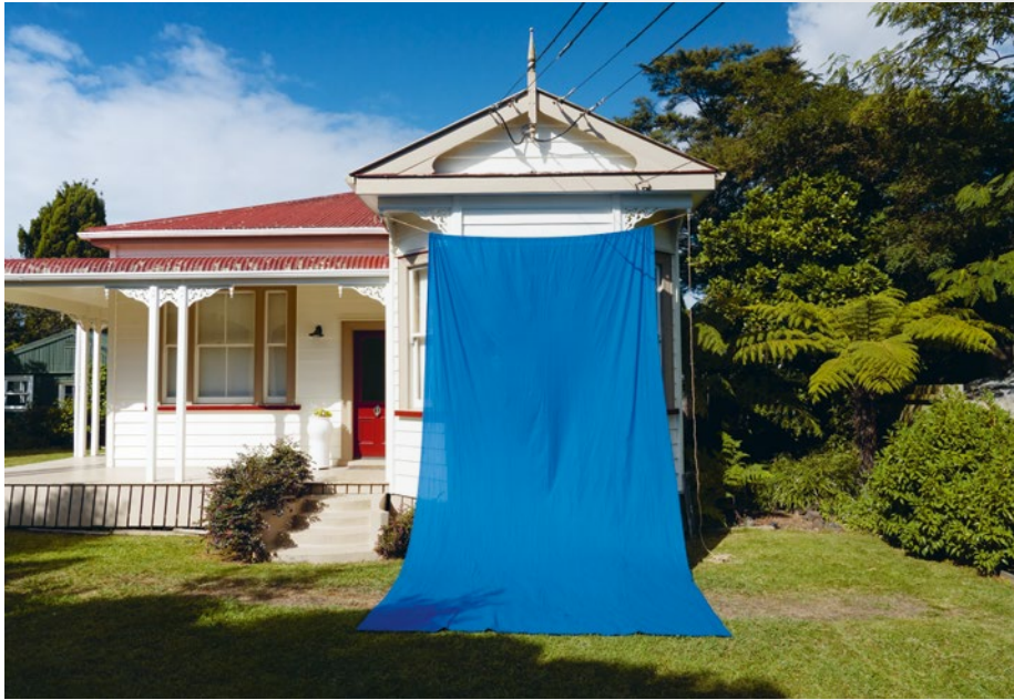
Clevedon , 2022, fine art print, 83 × 119 cm Arthur's Pass National Park , 2022, fine art print, 83 × 123 cm