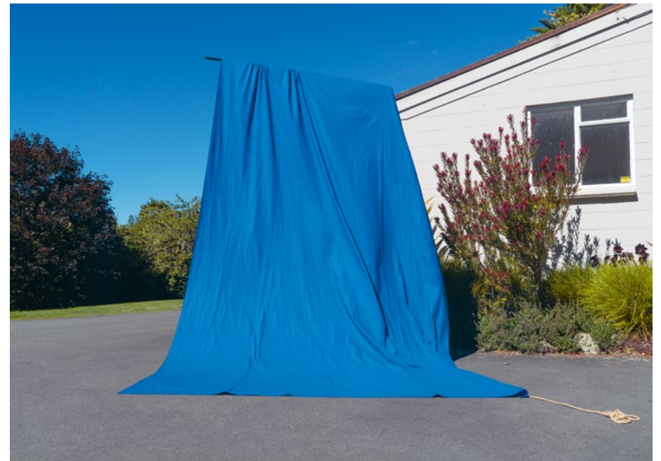
Levenburg , 2022, fine art print, 83 × 120 cm Isel Park Research Facility – Nelson Provincial Museum Pupuri Taonga o Te Tai Ao , 2022, fine art print, 83 × 115 cm