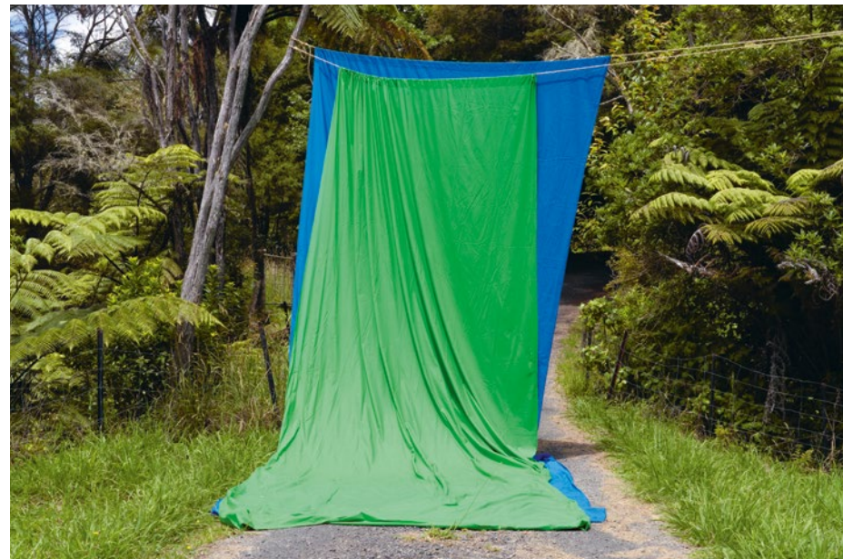
Kauaeranga Valley , 2022, fine art print, 83 × 123 cm